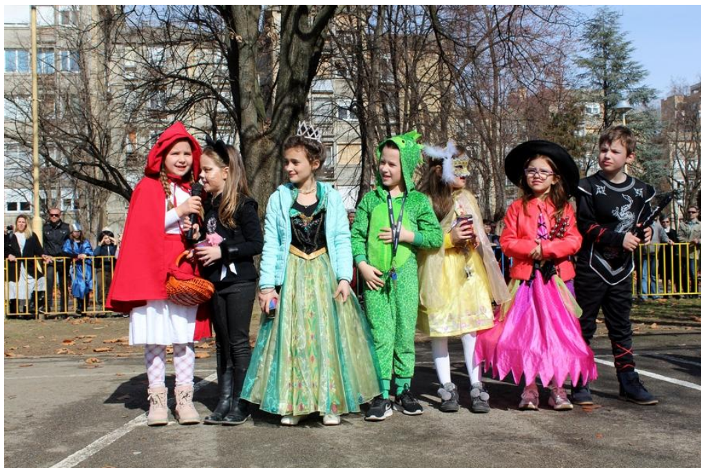
Obilježavanje Downovog sindroma