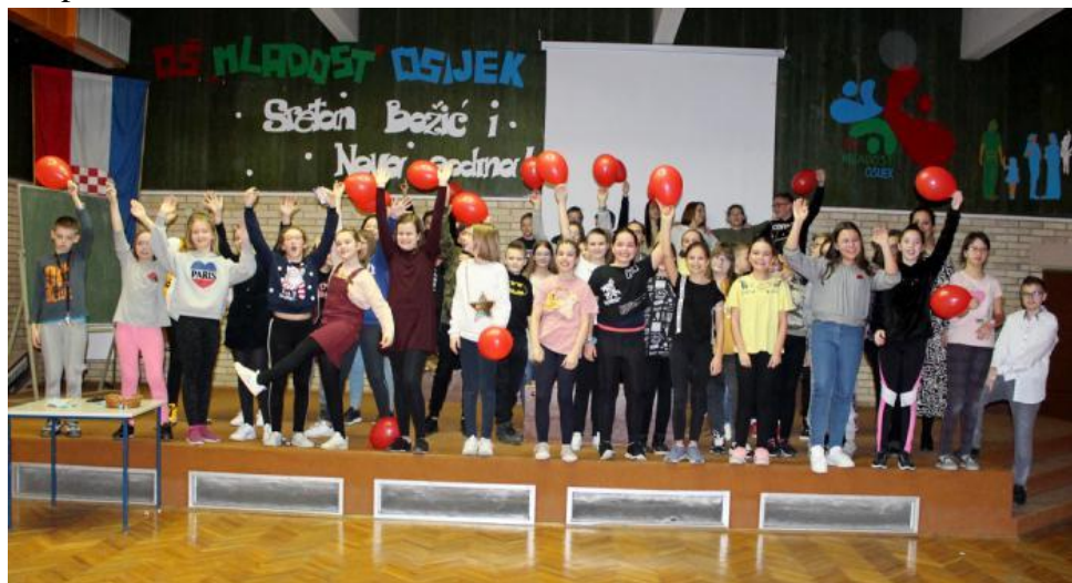
Dan hrvatske knjige- Noć knjige